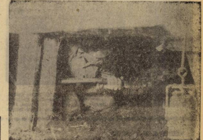
Az alacsony szénfalak mellől is csillébe kerül a szén, hogy növelje az üzem eredményeit.